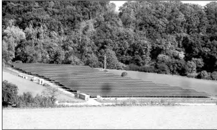
Die neu angelegte PV-Freiflächen-Anlage bei Hinterberg kann bis zu 400 Haushalte mit Strom versorgen.

2020 war nach dem im Februar 2023 veröffentlichten Energienut-