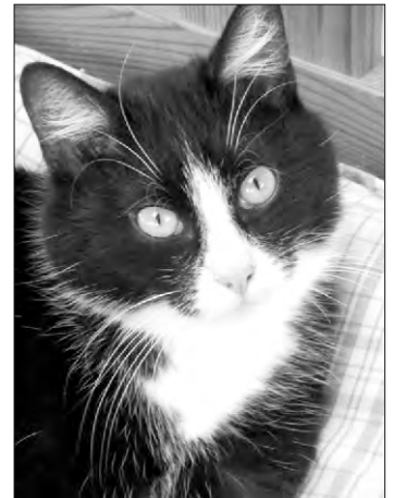
Dieser Straßenkater hatte Glück und hat in Pettendorf ein neues Zuhause gefunden

Auch die Gemeinde Pettendorf ist in letzter Zeit verstärkt mit dem Thema konfrontiert worden. Diese Katzen hatten aber das Glück, dass sich Privatpersonen in Zusammenarbeit mit dem Tierheim Regensburg um sie kümmern. Verwilderte Katzen sind in erster Linie betroffen, aber auch gepflegte und umsorgte Stubentiger können zu einer Verschärfung der Problematik beitragen, wenn er bzw. sie Freigänger und nicht kastriert sind. Die unkontrollierte Vermehrung der Tiere sorgt für immer mehr verwilderte Streunerkatzen, diese leiden oft unter Parasitenbefall, Infektionen und Mangelernährung. Selbst wenn sie gerettet und von einer Tierschutzorganisation aufgenommen werden, ist das „Happy End“ noch nicht garantiert. Oftmals kann kranken Tiere nicht mehr geholfen werden. Aber auch die Weitervermittlung ist problematisch, da die Streuner nicht an den Umgang mit Menschen ge-