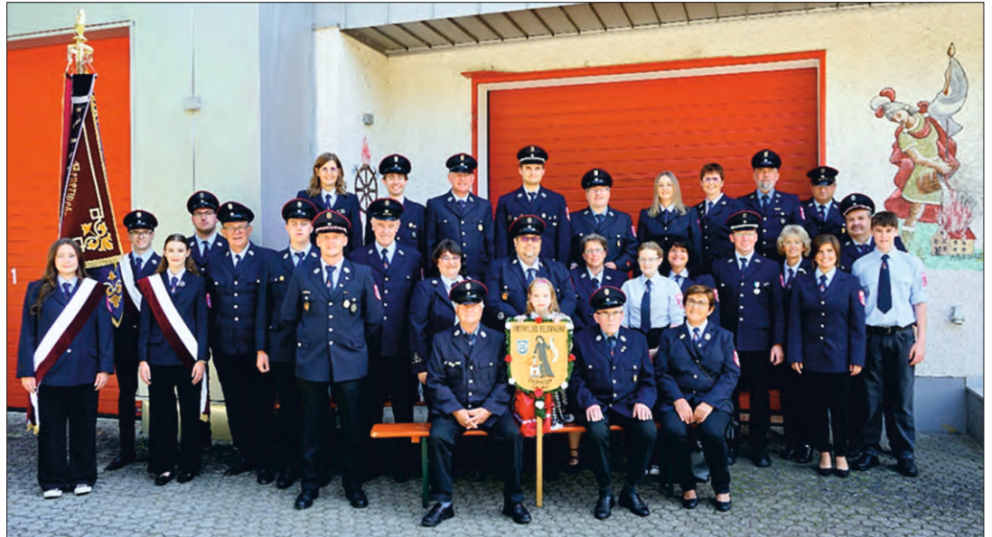
Feuerwehr Mariaort: Seit 150 Jahren im Dienst am Nächsten:

Eröffnet wurde das Geburtstagsfest der Floriansjünger mit einem feierlichen Festgottesdienst in der Mariaorter Wallfahrtskirche. Dieser wurde vom Bläserensemble der Kneitinge Dorfmusikanten begleitet und von Pfarrer Monsignore Lettner zelebriert. In seiner Predigt