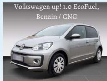
Volkswagen up! 1.0 EcoFuel, Benzin / CNG

Immer mehr Menschen abonnieren ein Auto, statt sich eins zu kaufen. Aus einer Analyse des Center Automotive Research (CAR) geht hervor, dass die Zahl der Auto-Abo-Abschlüsse von rund 42.000 im Jahr 2020 auf 63.000 im Jahr 2022 stieg. Der Markt für Auto-Abos dürfte sich auch in diesem Jahr weiter dynamisch entwickeln: Experten gehen von rund 100.000 Abschlüssen und einem Marktanteil von rund 10 Prozent aus. Bei einem Auto-Abo handelt es sich um eine Art Full-Service-Leasing mit besonders kurzen und flexiblen Laufzeiten. Der Fahrer zahlt einen monatlichen Betrag für die Auto-Nutzung, mit dem Versicherung, Werkstattkosten und Steuern bereits abgegolten sind - lediglich Energiekosten kommen noch obendrauf.