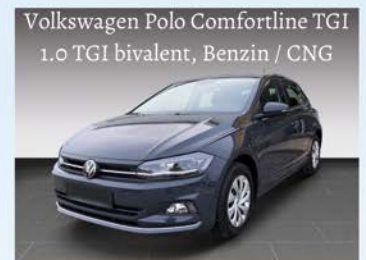
Volkswagen Polo Comfortline TGI 1.0 TGI bivalent, Benzin / CNG